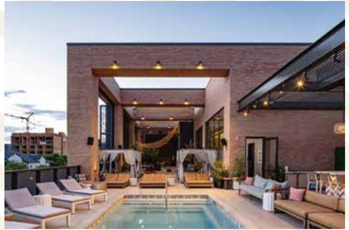
Edison House, Salt Lake City, USA