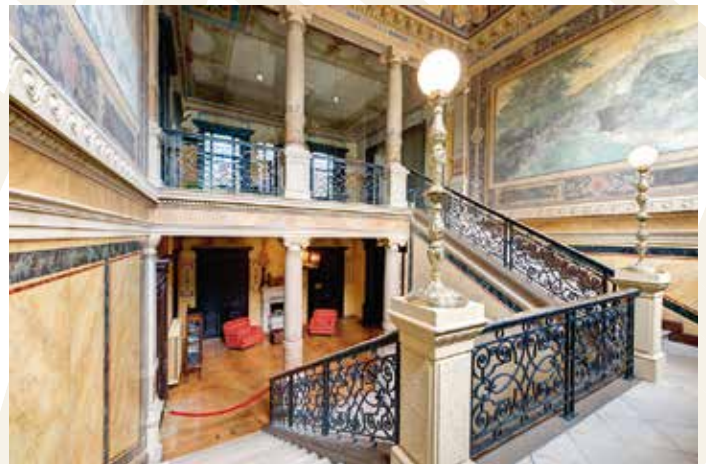
Club International e.V., Leipzig, Deutschland

Als Mitglied des Berlin Capital Club haben Sie die Möglichkeit, fast 250 exklusive Stadt-, Sport-, Country- und Golfclubs gegen Vorlage Ihrer persönlichen IAC-Karte oder IAC-App weltweit zu nutzen. So bieten Ihnen die renommierten Clubs in vielen internationalen Metropolen ein „Home away from Home“.