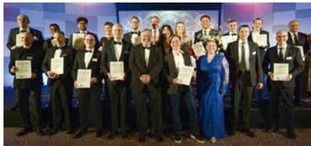
Innovationen in allen Formen und aus allen Bereichen der Wirtschaft: Die Preisträger „Innovator des Jahres“