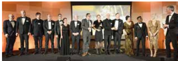
Sie konnten die begehrten Publikumspreise gewinnen: Der DeCarTrans-Forschungsverbund, die Tee-Plantagen-Entwickler Growing Karma sowie die Region Oberfranken