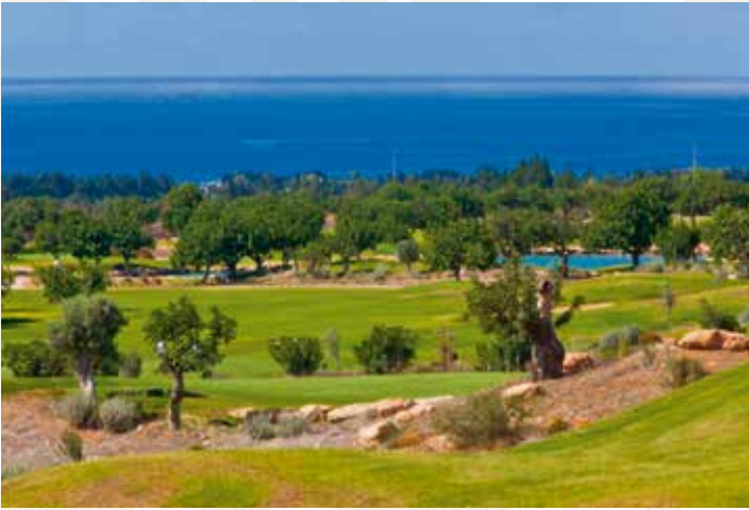
Elea Golf Club, Paphos, Zypern