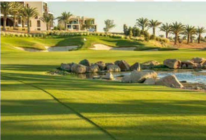
Ayla Golf Club, Aqaba, Jordanien