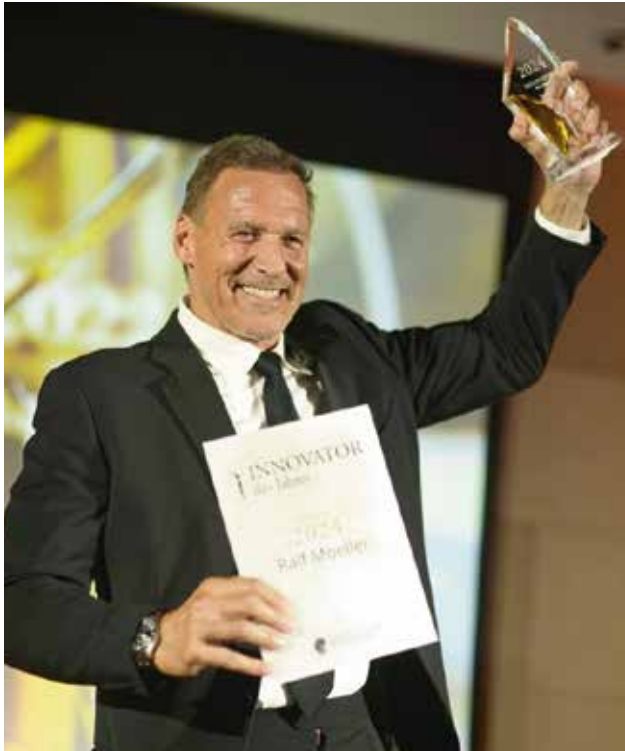
Hollywood-Star Ralf Moeller erhielt den Ehrenpreis 2024 für seine Unterstützung der Initiative „Motivation Handwerk“