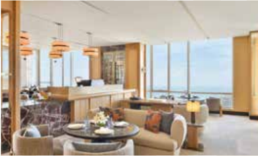
The Modernist, Mumbai, Indien