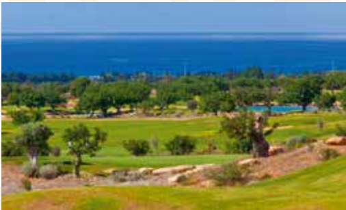
Eléa Golf Club, Paphos, Zypern

Als Mitglied des Berlin Capital Club haben Sie die Möglichkeit, fast 250 exklusive Stadt-, Sport-, Country- und Golfclubs gegen Vorlage Ihrer persönlichen IAC-Karte oder IAC-App weltweit zu nutzen. So bieten Ihnen die renommierten Clubs in vielen internationalen Metropolen ein „Home away from Home“.